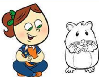
My hamster is orange.