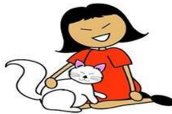
My cat is yellow.