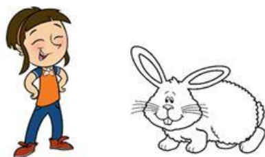
My rabbit is grey.