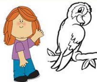
My parrot is colorful.