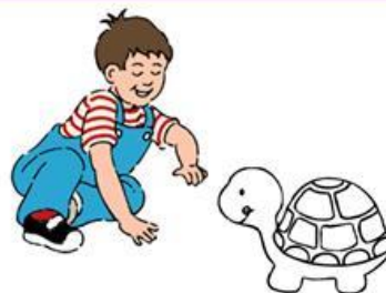
My turtle is green.