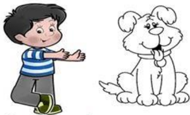
My dog is brown.