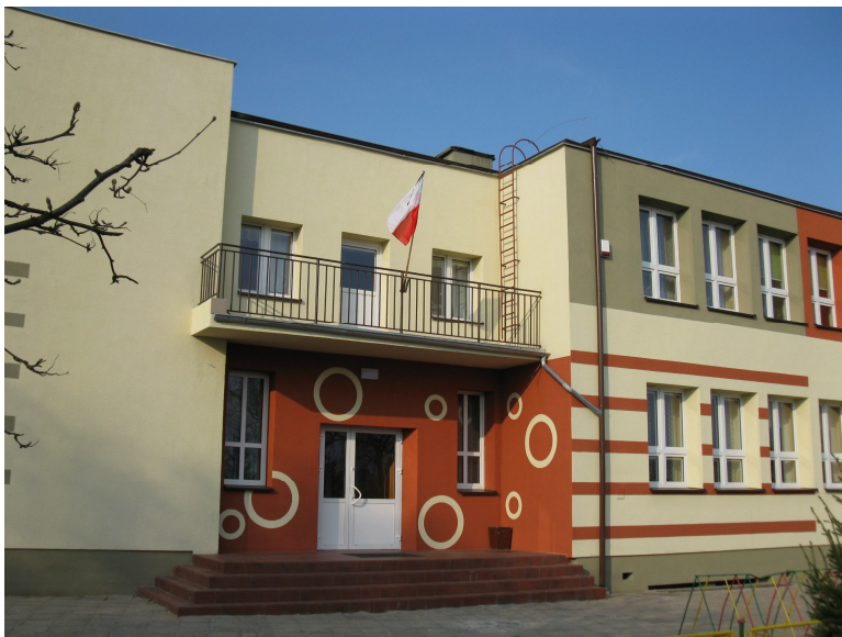
Budynek szkolny - wiosna 2010 r.