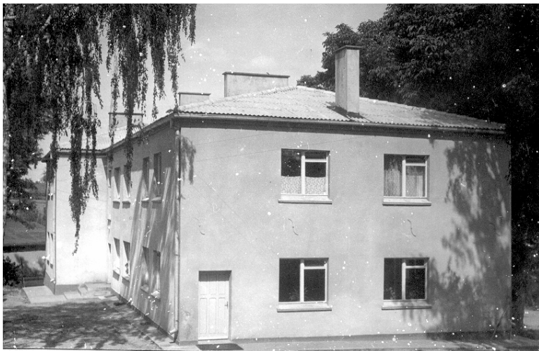
Wyremontowany budynek domu nauczyciela – 1967.