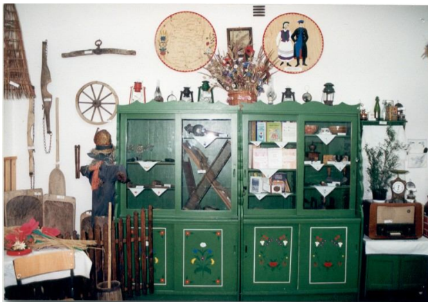
Izba regionalna - 1997 r.