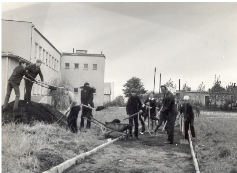
Młodzież z klasy VIII przy budowie bieżni – 1970 r.