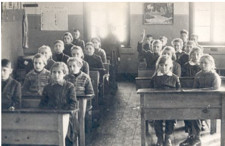
Jedna z trzech klas w starej szkole – 1956 r.

20 ław trzysiedzeniowych i oddała je jako dar dla szkoły. Podczas tych lat brakowało podręczników. Nauczyciele do nauki języka polskiego wykorzystywali gazet.